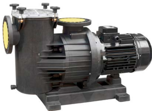
Girante in bronzo (a richiesta) Bronze impeller (on request) Turbina de bronce (bajo demanda) Turbine en bronze (sur demande)